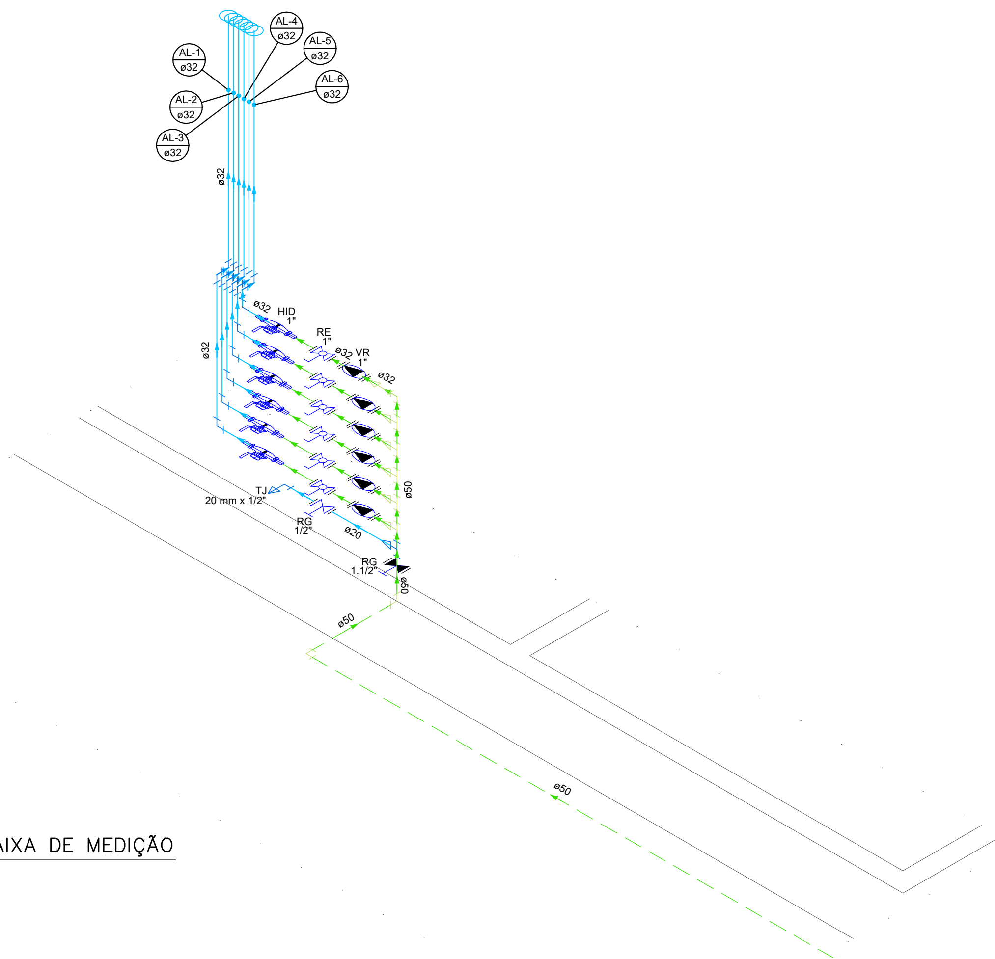
ISOMÉTRICO – CAIXA DE MEDIÇÃO ESCALA: 1/25